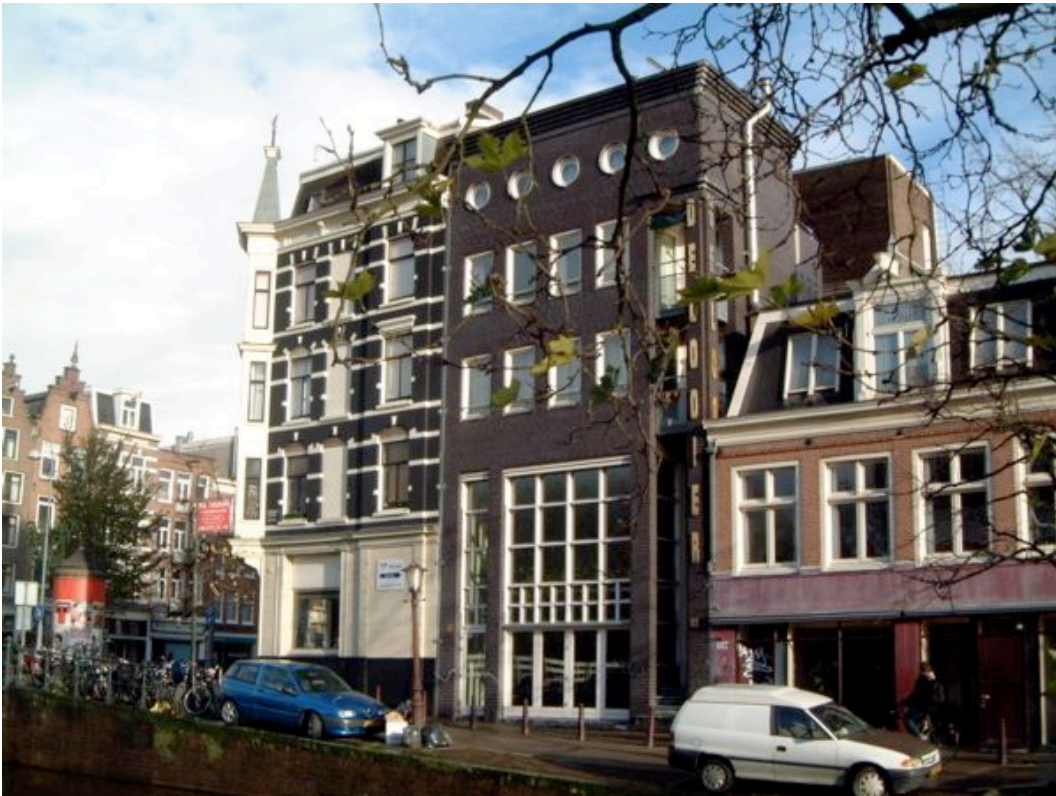
Foto boven: Bridgeclub de Looier Lijnbaansgracht 185 hoek Elandsgracht, naast de winkel voor grote maten.