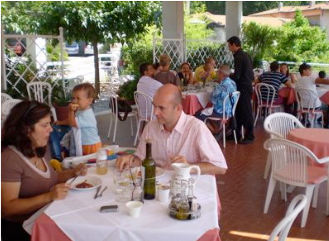
Boven: Het terras van Albergo Ristorante San Carlo in Toscane.