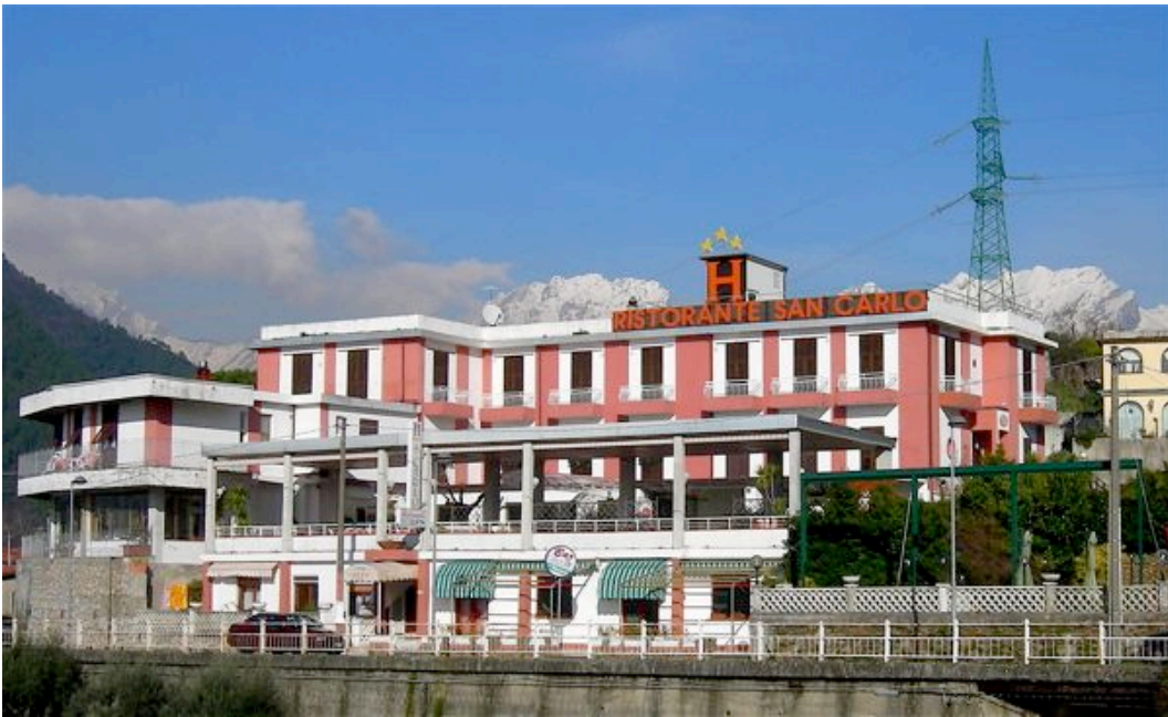
Foto boven: 'Albergo Ristorante San Carlo' het hotel van de Looier in Toscane.