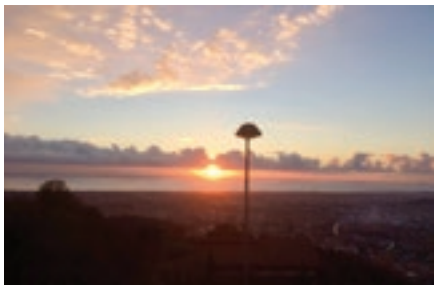
Foto boven: Het uitzicht vanaf ons terras op woensdag 13 december 2017

Als u in mei verhinderd bent, is een midweek begin juli wellicht mogelijk. Wij organiseren ook in de zomer namelijk een bridge-trip naar ons hotel. Het is dan soms wel wat warm, maar de kans op regen is kleiner.