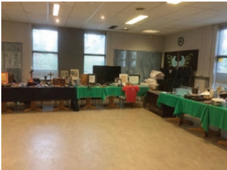
Foto boven: Een blik op de uitstalling van spullen tijdens de eerste veiling-markt in 'Het Zwanenmeer' aan de Beemsterstraat 491 in Amsterdam Noord.

Heerlijke heldere vissoep, daarna bleek er nog maar één van de vis-schotels die we besteld hadden aanwezig. Aangezien ik toch al twijfelde tussen de zalm en die andere, waarvan de naam me ontschoten is, heb ik de zalm als hoofdgerecht genomen. Verrukkelijk! Jammer dat het gebakken ijs, waar Yolanda zo dol op is, dit keer niet de kwaliteit had die ze gewend is. Ik had bolletjes ijs die in rijst-flensjes waren verpakt. Zag er heel leuk uit, maar ik ben geen liefhebber van rijst. Ik kende dus het risico, maar wil altijd alles proberen. Alles netjes opgegeten, maar ik zal dat gerecht niet snel opnieuw bestellen.