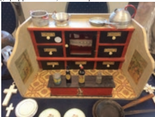
Foto boven: Niemand gezien die één Euro voor dit winkeltje wilde bieden. Zaterdag 27 januari, wordt een nieuwe poging ondernomen dit winkeltje te slijten.

De markt in het Zwanenmeer was wat bezoekersaantallen betreft een groot fiasco. Er kwam namelijk helemaal niemand op af! Noch standhouders die een tafeltje huurden, noch bezoekers om een oog op de uitgestalde koopwaar te laten vallen. Genoeg koopjes te scoren, want na de markt, 's middags om 4 uur, zou er een veiling worden gehouden. Op die veiling is evenmin iemand afgekomen. Dáár had een grote slag geslagen kunnen worden. Alle artikelen die de Looier niet meer naar haar opslag wilde terugslenpen, zouden met een startprijs van slechts één Euro aangeboden worden. Wat te denken bijvoorbeeld van dit schattige poppenwinkeltje voor 'n pick?