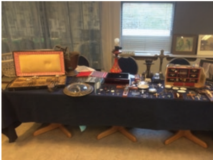
Foto boven: Een van de uitstallingen op één der vorige VeilingMarkten

Kom zaterdagmiddag de 28ste september naar de Beemsterstraat 491 in Amsterdam Noord en bezoek de beeldenexpositie, de markt en de veiling.